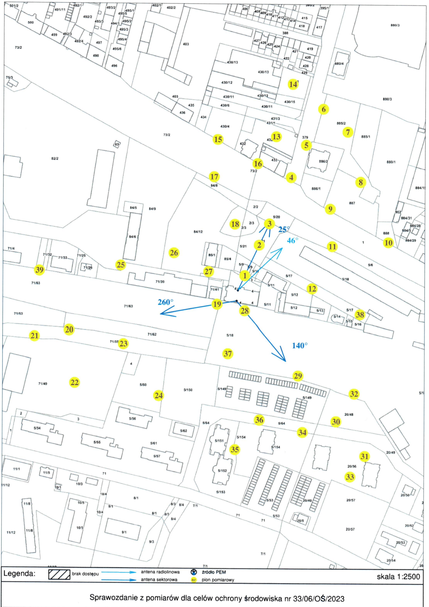
Rys. 2 Lokalizacja pionów pomiarowych