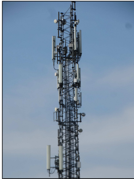
Rys. 3 Widok badanego obiektu