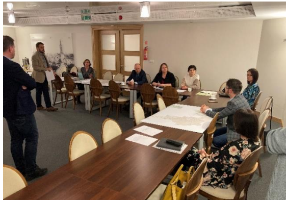
Zdj.: Spotkanie 14 lutego 2023 r.

Podczas obu spotkań z udziałem mieszkańców wykonawcy raportu diagnostycznego oraz przedstawiciele Urzędu Miejskiego w Elblągu starali się odpowiedzieć na wszystkie pytania i wyjaśnić wątpliwości występujące po stronie interesariuszy.