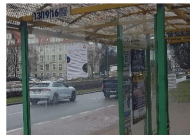
Zdj.: Miejsca dystrybucji plakatów z informacjami o konsultacjach społecznych