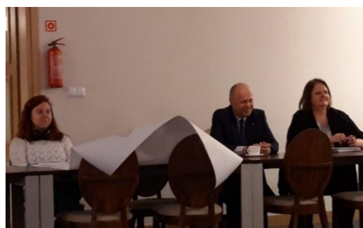
Zdj.: Debata 13 lutego 2023 r.