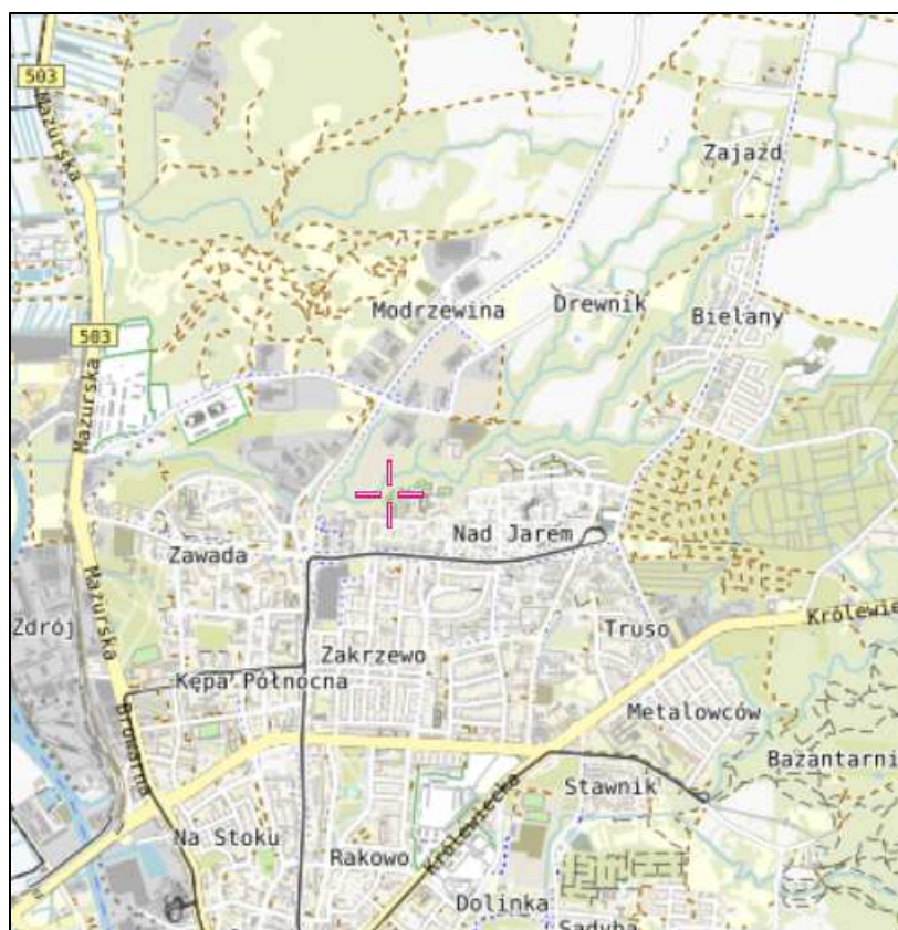
Rys. 1 Lokalizacja badanego obiektu